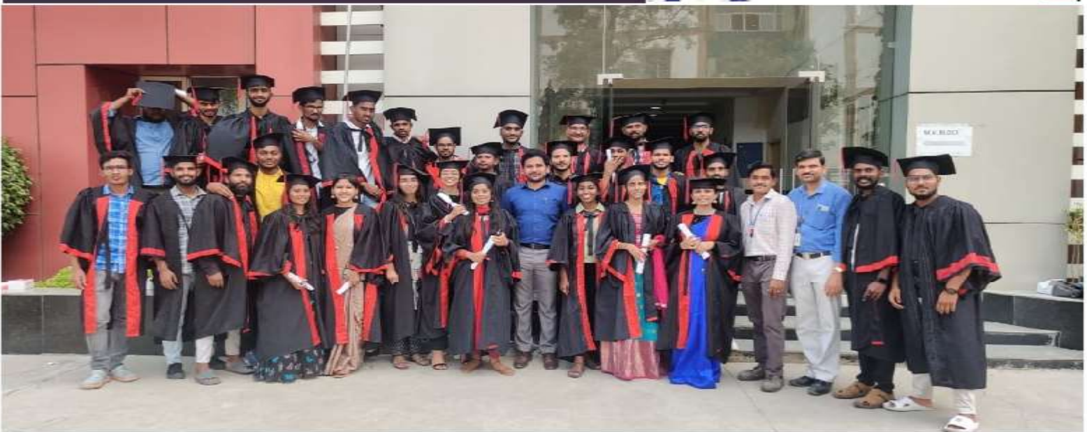
GRADUATION DAY CELEBRATIONS 2K22 (21 BATCH)