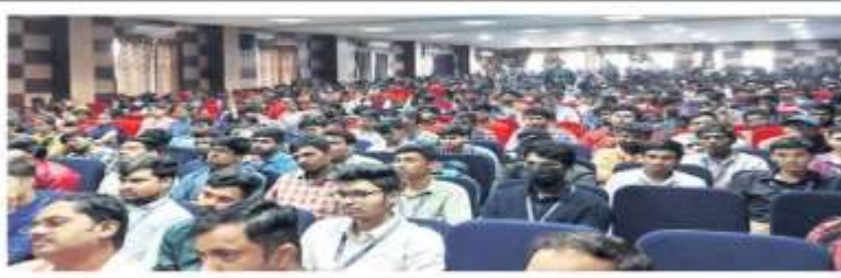
సమీనార్లో పాల్గొన్న విద్యార్థులు